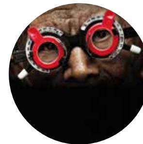
THE LOOK OF SILENCE