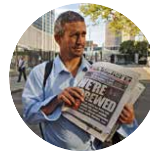
THE YES MEN ARE REVOLTING