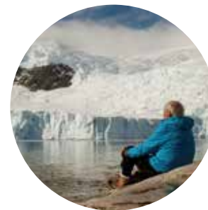
THE ICE AND THE SKY