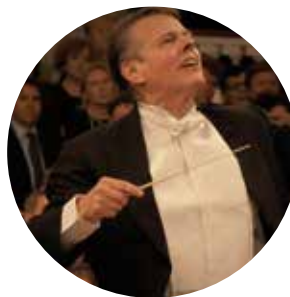
AROUND THE WORLD IN 50 CONCERTS